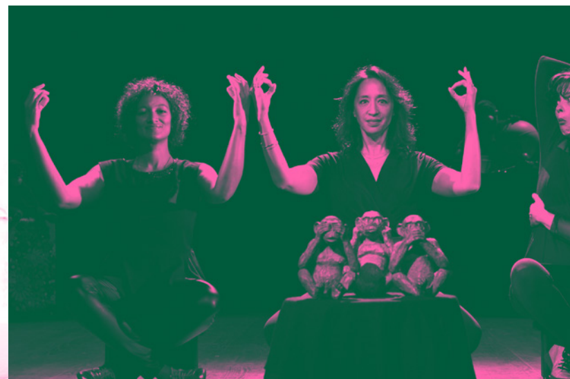
SAGE COMME SINGE