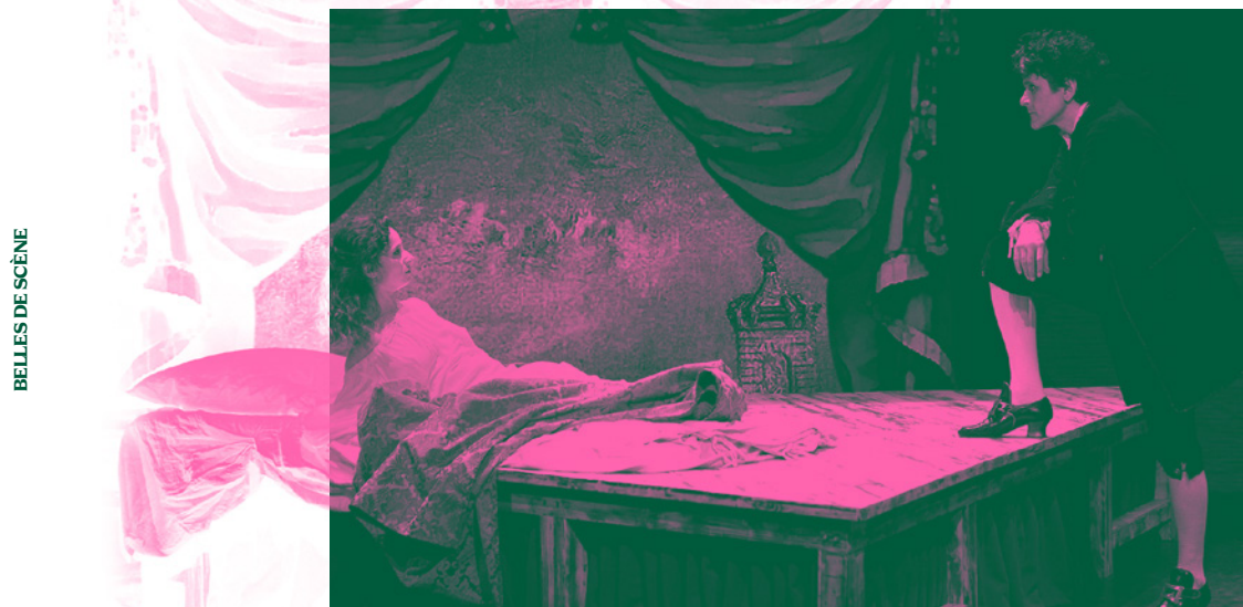
BELLES DE SCÈNE